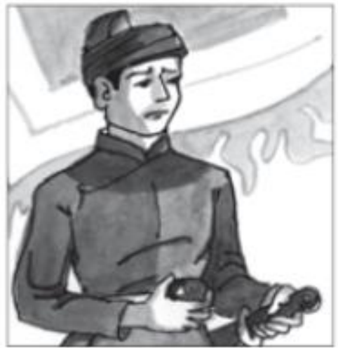
Trần Quốc Toản

và câu hỏi thảo luận (bảng phụ) để học sinh thảo luận về gương chiến đấu của 4 anh hùng liệt sĩ đó.