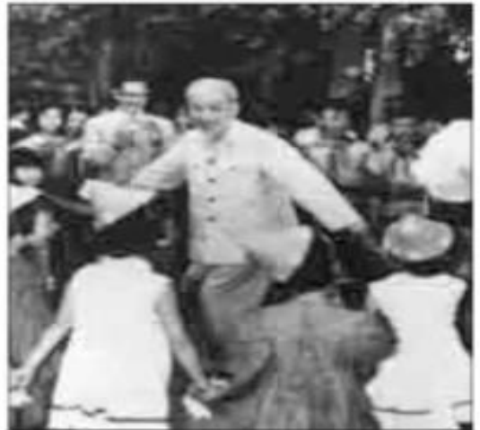
Ảnh 2 : .....