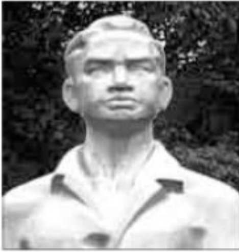
Lý Tự Trọng