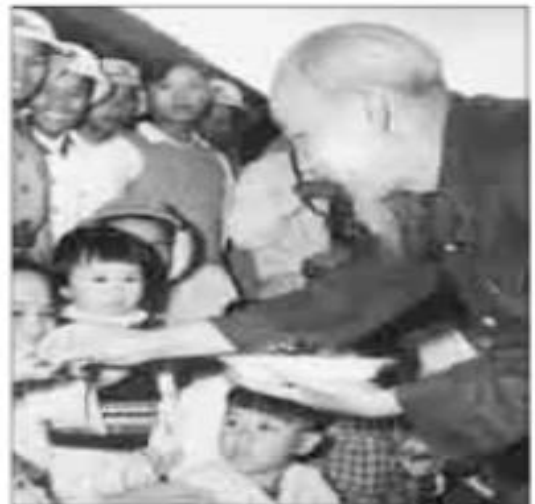
Ảnh 4 : .....