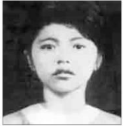
Võ Thị Sáu