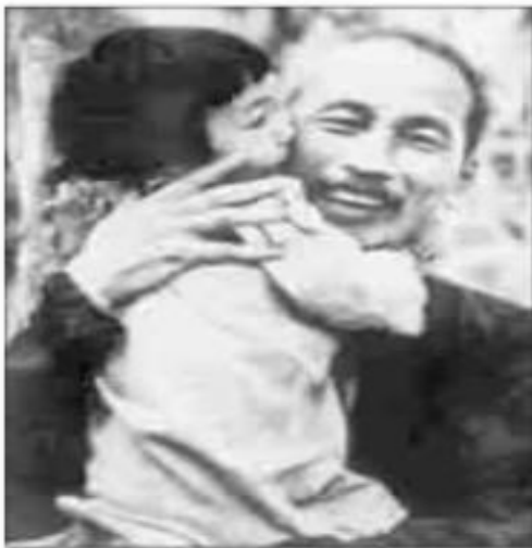
Ảnh 3 : .....