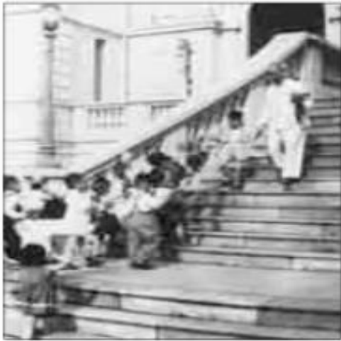
Ảnh 1 : .....