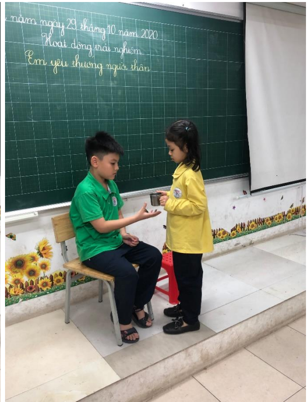
Các bạn HS lớp 1A7 đóng vai và thực hành nói lời yêu thương với người thân