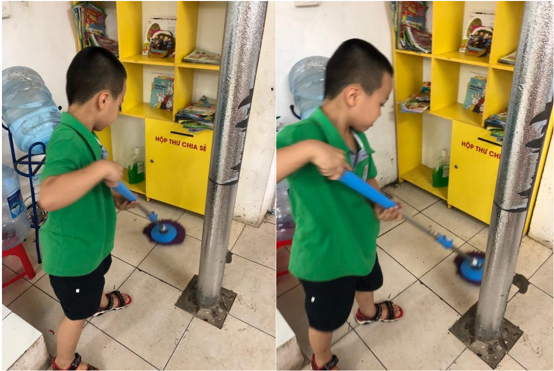
Các thành viên của 1A7 thực hành sắp xếp lại đồ dùng học tập và vệ sinh lớp học khi học hoạt động “Lớp học sạch, đẹp”