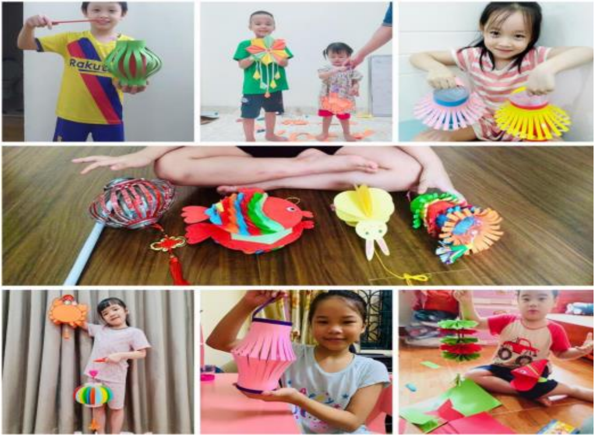
Các hoạt động của học sinh đón Tết Trung Thu