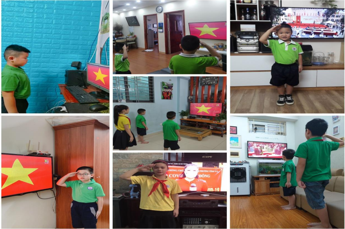
GV và học sinh dự Lễ Khai giảng năm học mới trực tuyến