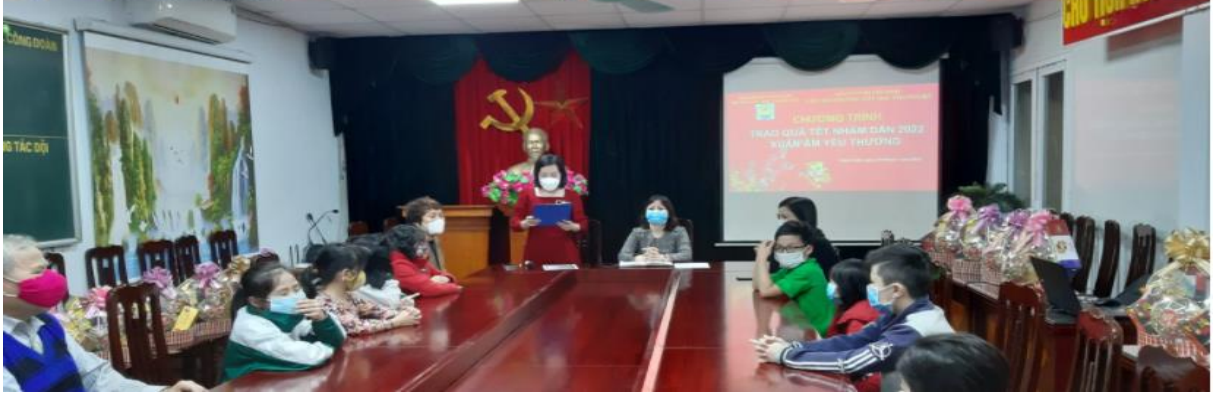
Tọa đàm và tặng quà Tết “Xuân ấm yêu thương”