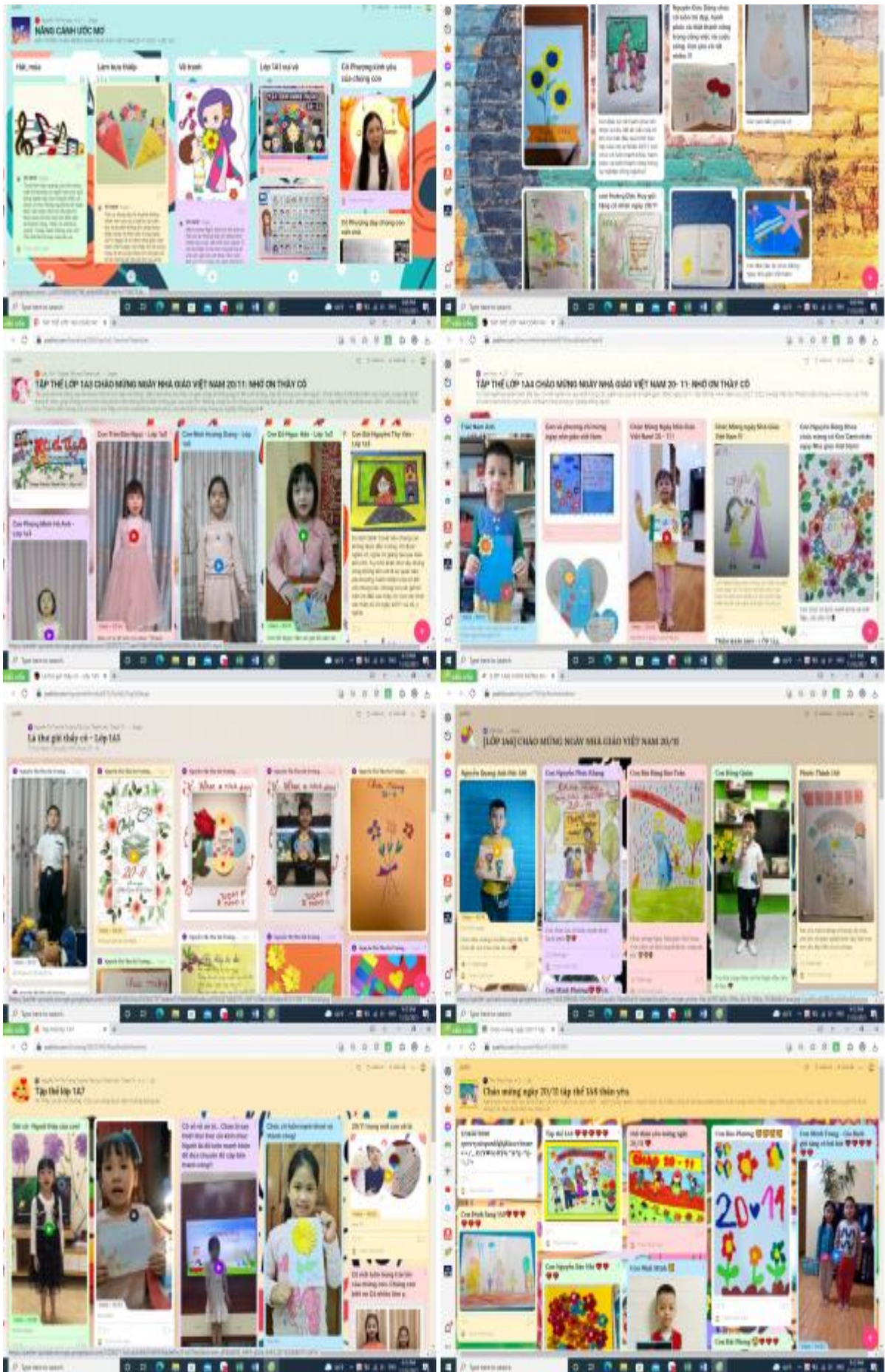
Chùm hoạt động Tri ân ngày nhà giáo Việt Nam 20/11