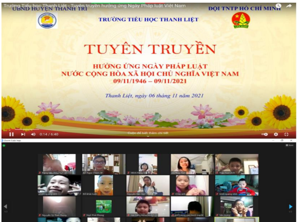
Học sinh hưởng ứng Ngày Pháp luật 9/11